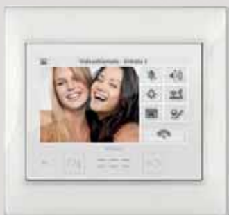
Sistema domotico By-me