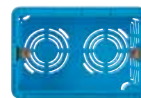
Scatola da incasso 3 moduli

Dal 1 al 30 Novembre 2017. Solo presso i grossisti che partecipano alla promozione e fino ad esaurimento scorte.