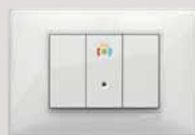
Sistema antintrusione By-alarm