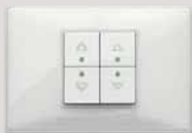
Automazione per gli edifici Well-contact Plus