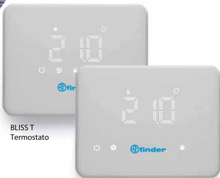
BLISS T Termostato

BLISS T è invece la soluzione più rapida per gestire la temperatura in casa, con stile.