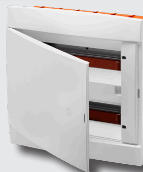
CENTRALINO PORTELLA CIECA 24 MODULI

Promozione valida per ordini in soluzione unica effettuati e fatturati nel periodo che va dal 2 maggio al 31 maggio.